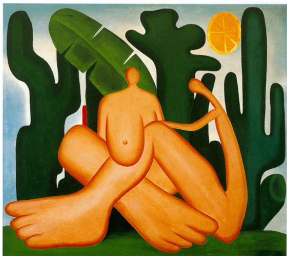
Antropofagia , de Tarsila do Amaral. 1929.